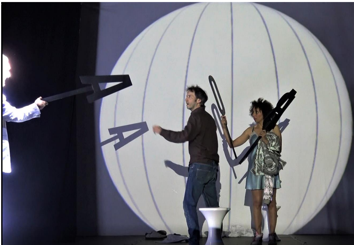
PHOTOGRAPHIES PRISES LORS DE LA CRÉATION DU SPECTACLE AU CENTRE CULTUREL RATP AUGUSTE DOBEL EN MAI 2019

Car le savoir, par définition, ne se livre pas directement : il nécessite un apprentissage par l'assimilation de règles et de codes enseignés par un maître. Des règles et des codes que l'on ne peut édicter soi-même et que l'on est obligé d'accepter parce qu'on nous les dit universels, sans qu'ils puissent être pour autant considérés comme des vérités incontestables. Le Nouveau dictionnaire universel précise ainsi que « la géométrie envisage les corps dans un état d'abstraction [et que] les vérités qu'elle démontre sont des vérités hypothétiques ». C'est en tombant sur cette définition, dans une exposition consacrée à l'artiste minimaliste belge Pol Bury, que j'ai perçu combien la filiation était grande entre univers théâtral et univers géométrique : « Tout corps a un volume , puisqu'il occupe une place dans l'espace ; tout corps a une surface qui le sépare de l'espace environnant ; lorsque les surfaces de deux corps se rencontrent, le lieu où elles se rencontrent est appelé ligne . On peut concevoir les volumes, les surfaces, les lignes, indépendamment des corps auxquels ils appartiennent, et à cet état abstrait on les nomme figures ».